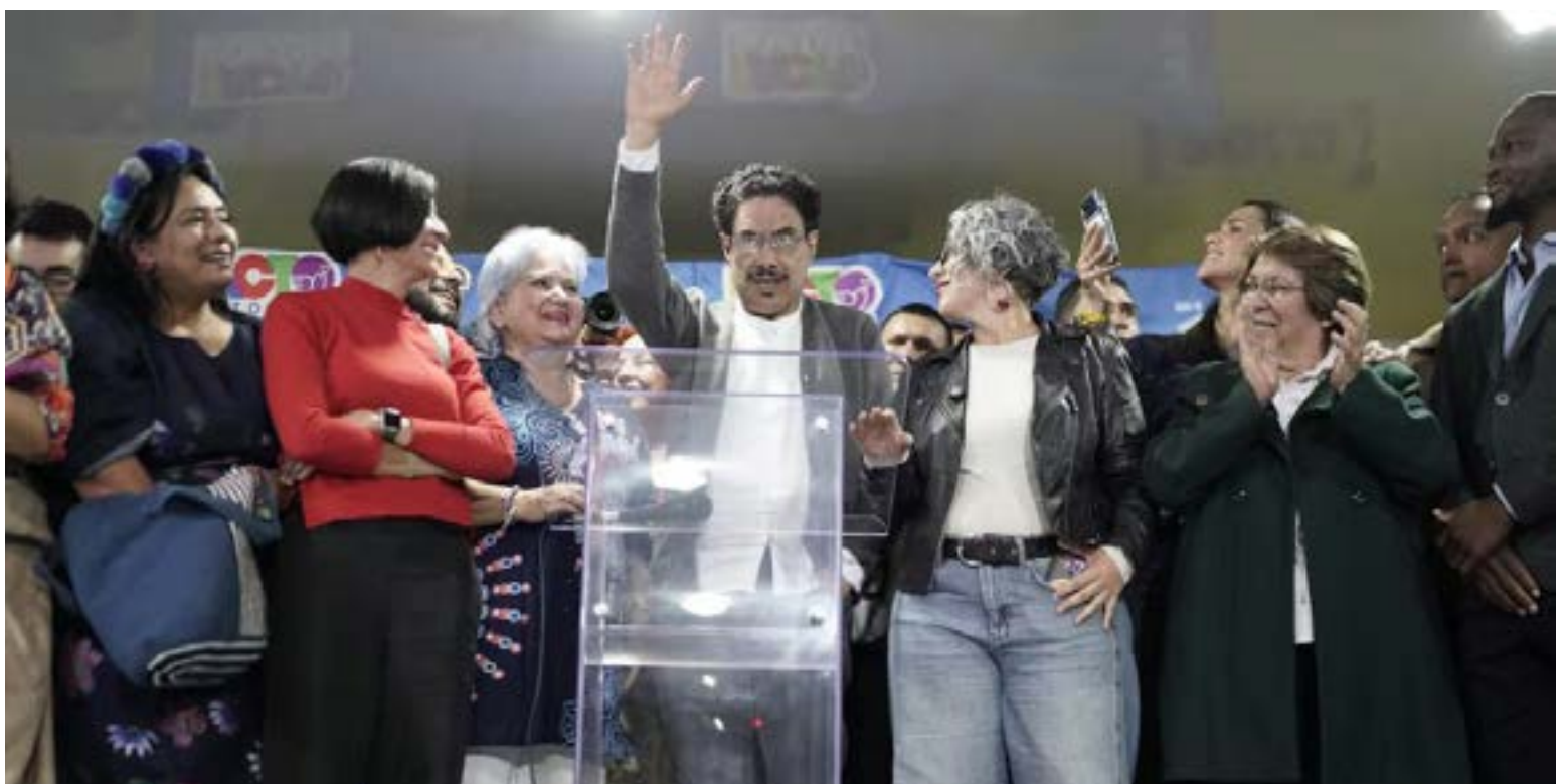
Iván Cepeda Castro, ganador de la Consulta del Pacto Histórico

E l Pacto Histórico celebró su consulta interna con más de 2 millones de personas que votaron en la consulta del Pacto Histórico, y que deja como ganador a Iván Cepeda, para elegir a su candidato presidencial de cara a las elecciones de 2026, así como sus listas al Congreso. El proceso, que estuvo marcado por controversias y obstáculos jurídicos, tuvo como claro ganador al senador Iván Cepeda Castro.