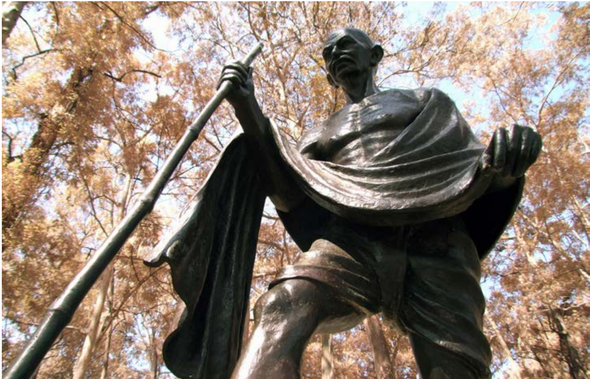
Estatua de Gandhi en Sao Paulo, obra de Gautam Pal.