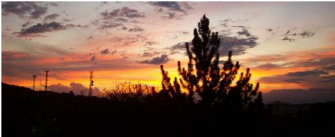
Atardecer en Pereira

Como parte fundamental de este patrimonio de la UNESCO, Pereira brinda acceso a fincas cafeteras tradicionales donde los visitantes pueden conocer el proceso del grano, desde la siembra hasta la taza, disfrutando de paisajes montañosos salpicados de cafetales. Termas de Santa Rosa de Cabal y San Vicente: A