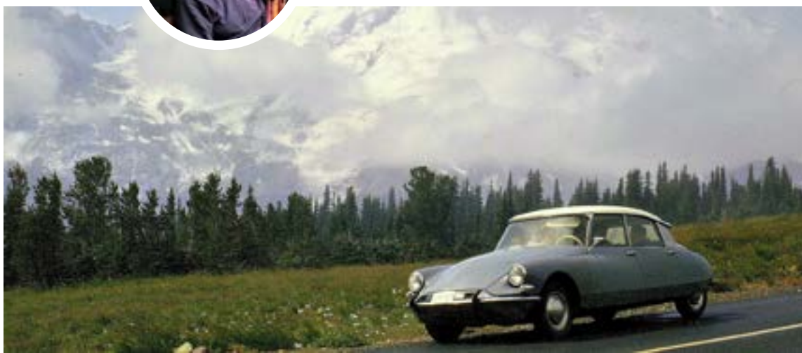
DS Citroen near Mt. Baker

El DS, cuyo nombre deriva de Déesse «diosa» en francés, fue concebido por el diseñador Flaminio Bertoni, escultor italiano que, persiguiendo el amor, terminó en Francia como director de diseño de Citroën, y por el ingeniero aeronáutico André Lefèbvre. Juntos crearon desde el Traction Avant, primer auto con tracción delantera producido en masa, con 758.948 unidades entre 1934 y 1957, hasta el utilitario 2CV y, finalmente, el revolucionario DS, que desafiaba toda lógica. Mientras los Mercedes-Benz y Rolls-Royce de la época eran estructuras rectas y pesadas, el Citroën DS parecía flotar sobre