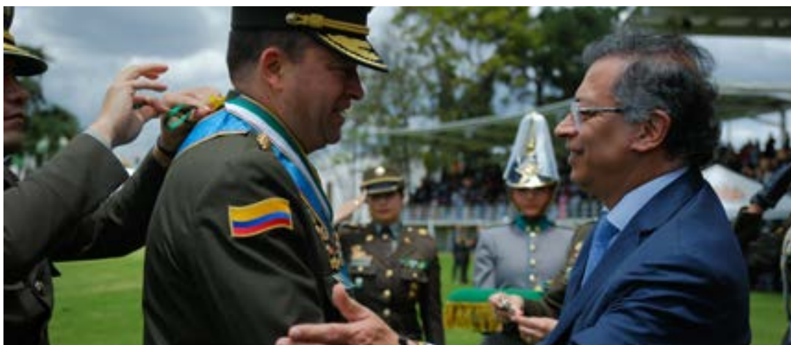
El nuevo director general de la Policía Nacional, brigadier general William Oswaldo Rincón Zambrano, en cumplimiento de la orden impartida por el Jefe de Estado, iniciará operativos para dismantelar la mafia de los compradores de votos.

Denunció que están ingresando al país grupos «para intentar desestabilizar, a partir de violencia, las elecciones», con el fin de «confrontar el Estado de Colombia, el Gobierno de Colombia, asesinando, poniendo en riesgo la elección». El presidente concluyó que la estabilidad de Colombia es crucial, pues el país es el «faro firme en el Caribe y en los Andes, en toda América Latina», y desestabilizarlo implicaría desestabilizar toda la región.