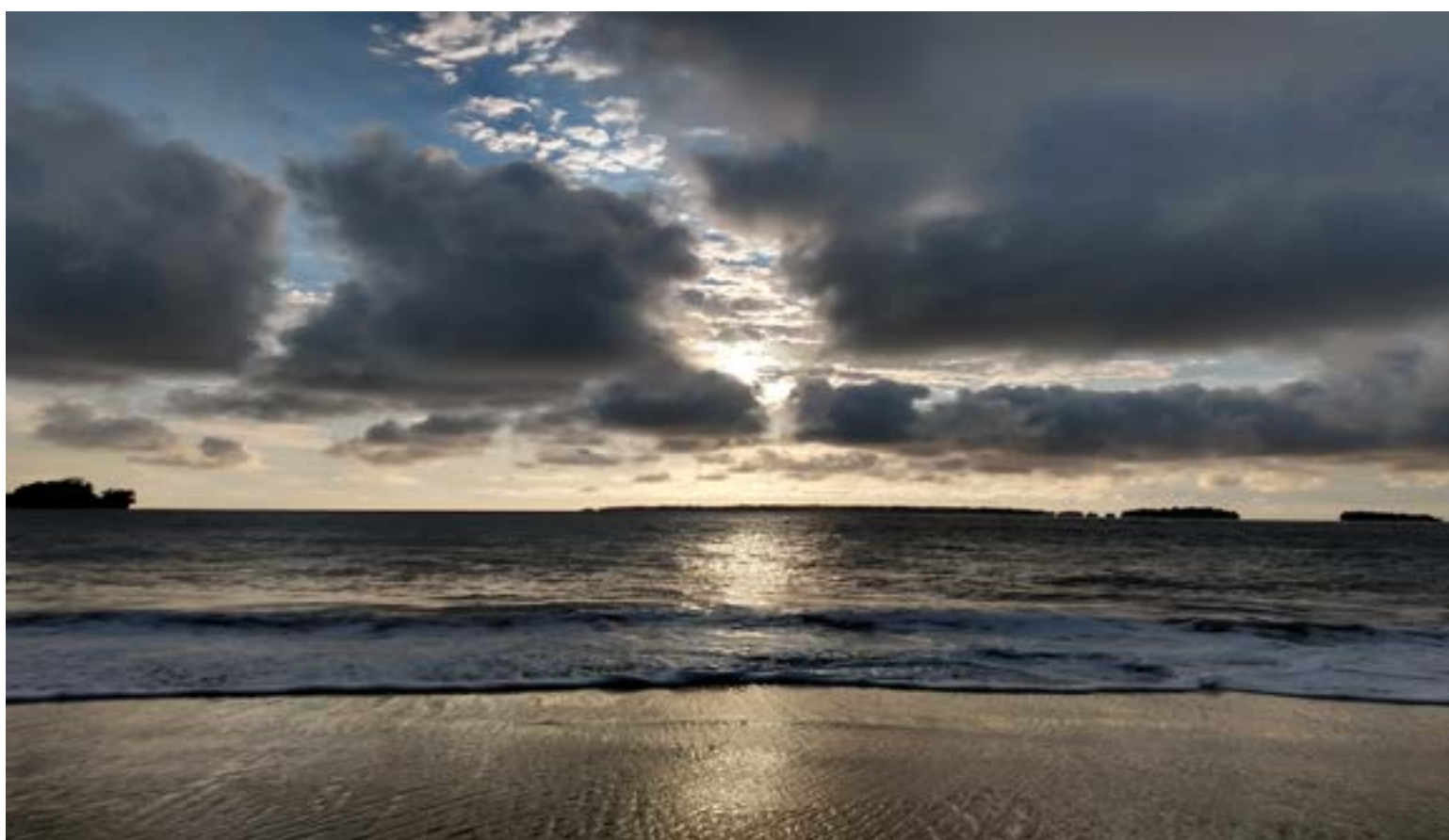
Las nubes oscuras de la extorsión se han instalado en la costa pacífico y en especial a Buenaventura

La esencia de la crisis que Colombia pasa no va más allá de una verdad de puño: o paga o pierde.