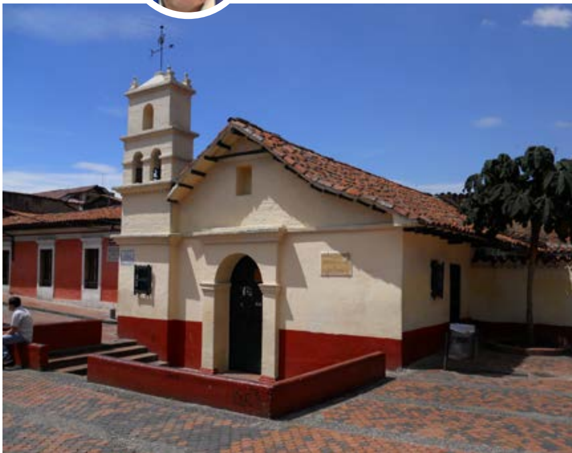
En la Iglesia de la Plaza del Chorro Quevedo de acuerdo con los historiadores fue el sitio donde se fundó Bogotá

Hecha la supuesta fundación, se dispone regresar a España, para rendir