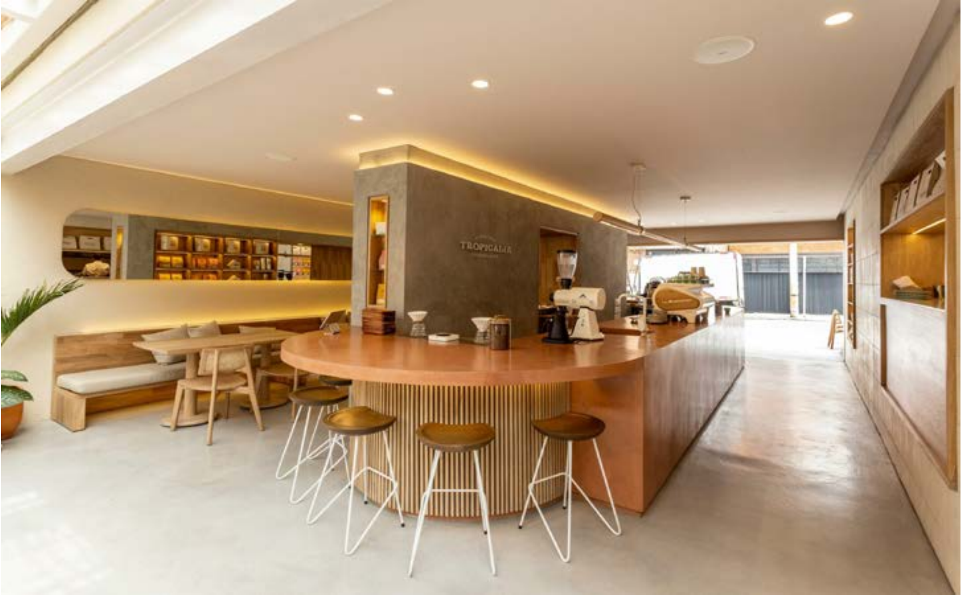
Tropicalia Coffee (Colombia) en el primer lugar regional y un sobresaliente puesto número 10 a nivel mundial.