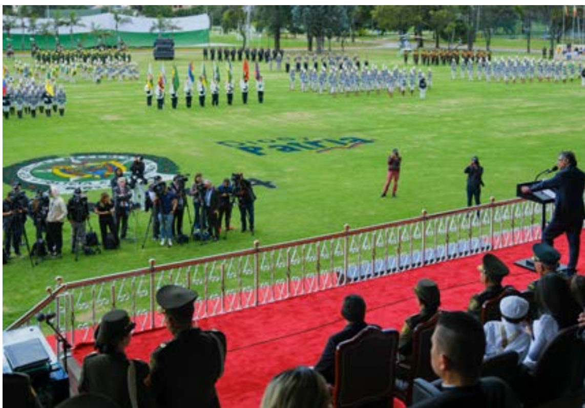
Petro, ha declarado una «guerra abierta» contra el flagelo de la compra de votos. La orden a todos los policías de Colombia capturar a los compradores de votos.

Petro denunció de manera enfática el origen del