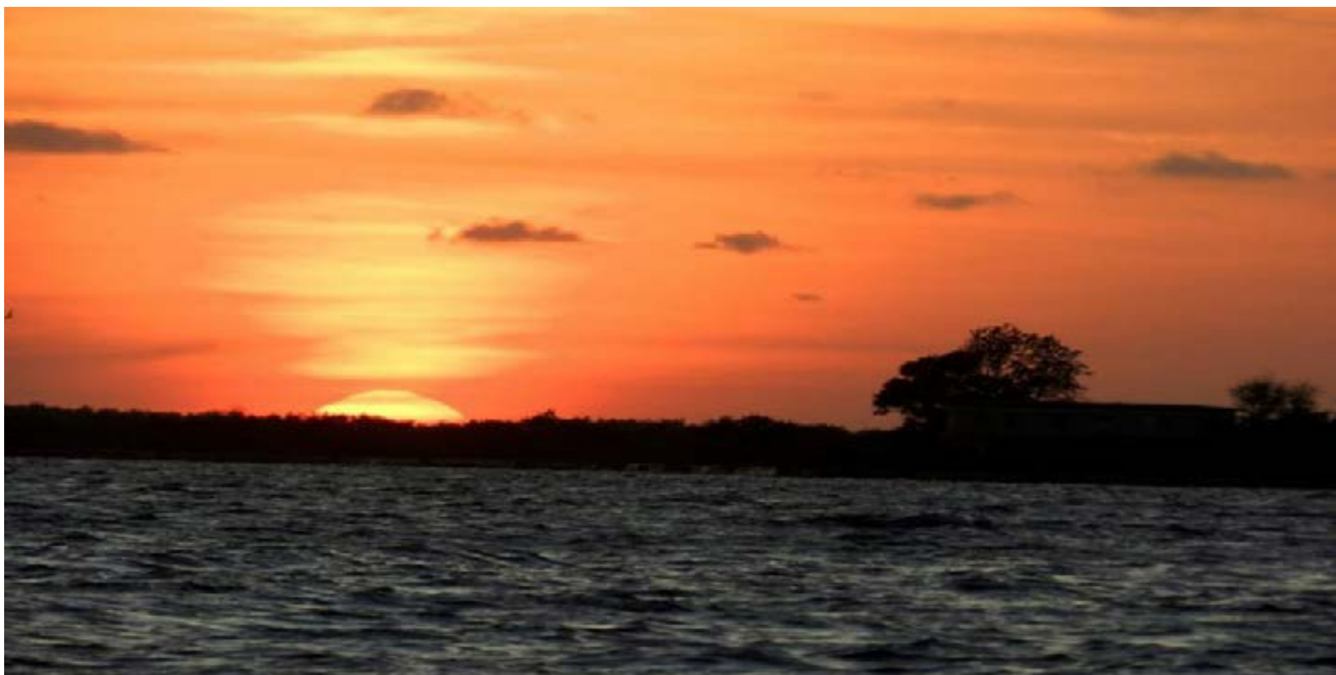
Paisaje inmortalizado por el tiempo

Texto y fotos Lázaro David Najarro Pujol. Primicia Diario Cuba